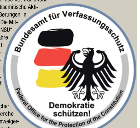
Logo des Verfassungsschutzes: „Demokratie schützen“

cher Verstrickungen in angeblich links- oder rechtsmotivierte Straftaten und Morde. Die Strippenzieher bei bundesdeutschen Geheimdiensten zu suchen, dürfte daher weitaus effektiver sein! (re)