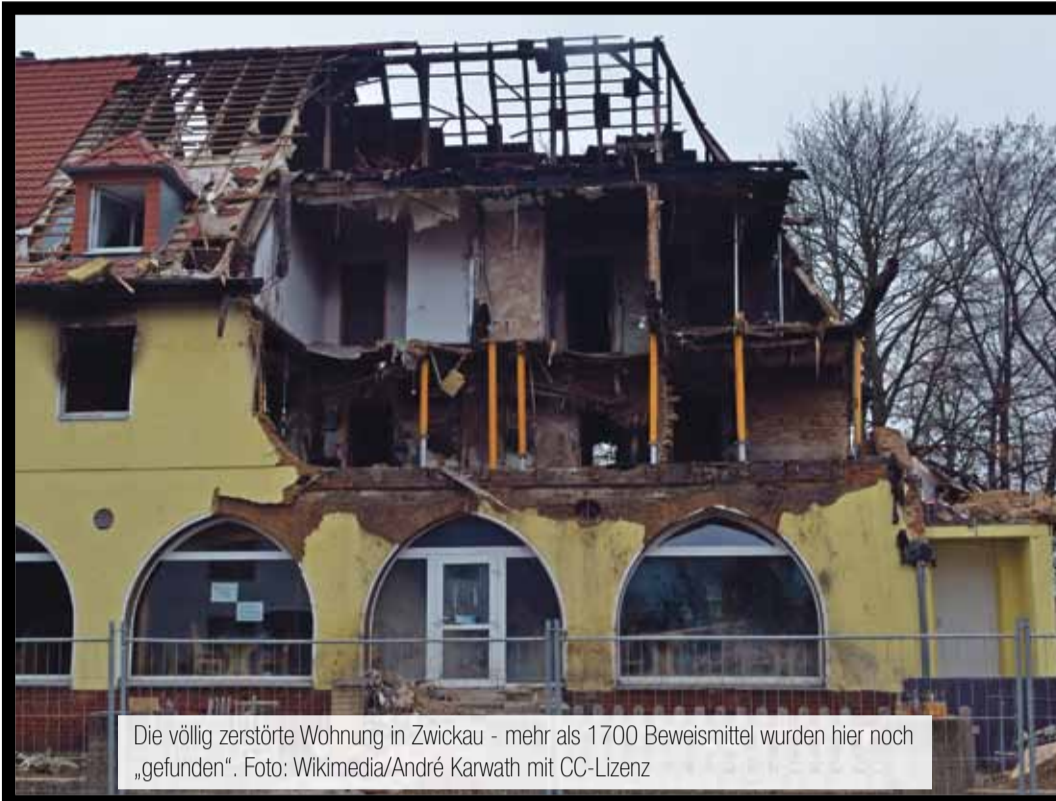
Die völlig zerstörte Wohnung in Zwickau - mehr als 1700 Beweismittel wurden hier noch „gefunden“.

++ US-Geheimdienst verfolgt eigene Interessen +++ Viele ungeklärte Fragen