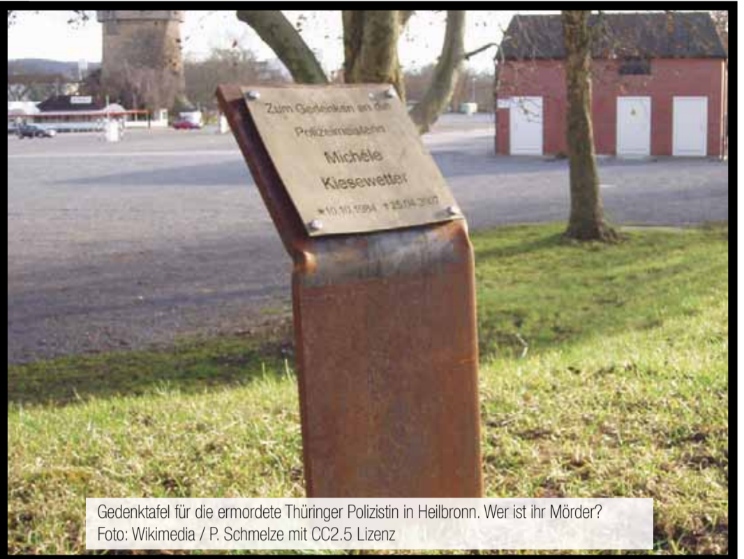
Gedenktafel für die ermordete Thüringer Polizistin in Heilbronn. Wer ist ihr Mörder?

rechtsstaatlichen Grundsätzen vor allem eines: Beweisen. Weder die „Döner-Morde“, noch der Mord an der Polizistin Michèle Kiesewetter können dem Trio bislang zweifellos zugeschrieben werden. Medien und Bundesanwaltschaft bezeichnen diese aber ohne abgeschlossenes Verfahren übereinstimmend als Täter. Auch hier werden rechtsstaatliche Grundsätze quasi im Eilverfahren außer Kraft gesetzt - in dubio pro BRD.